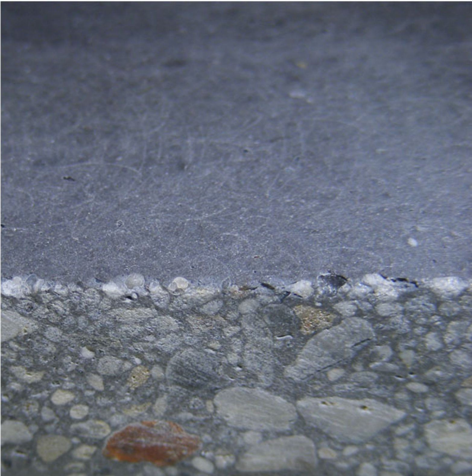
Schnitt durch eine Betonplatte

Beton wird aus Wasser, Zement und Gesteinskörnungen hergestellt. Bei unserem Sichtbeton gibt die äußerste Zementsteinschicht die farbliche Wirkung. Wird der Betonstein geschnitten oder stark geschliffen, werden die verschiedenen Gesteinskörnungen sichtbar.